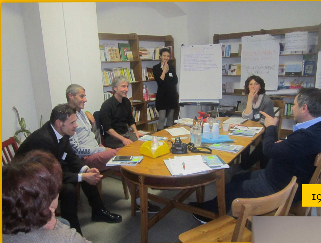
19 febbraio Commercianti Vignola