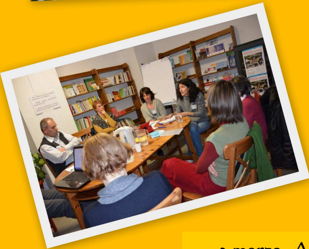
3 marzo Associazioni Vignola