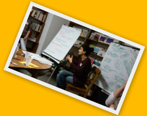
26 febbraio Associazioni Vignola